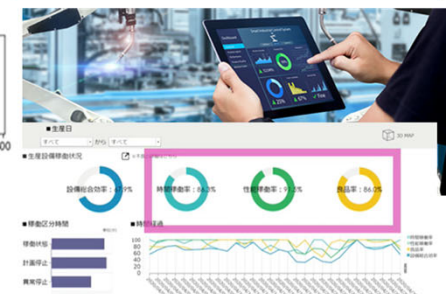
図 デジタルツインの生成とデジタル・ダッシュボードによる生産性・異常予知を学修する演習教材