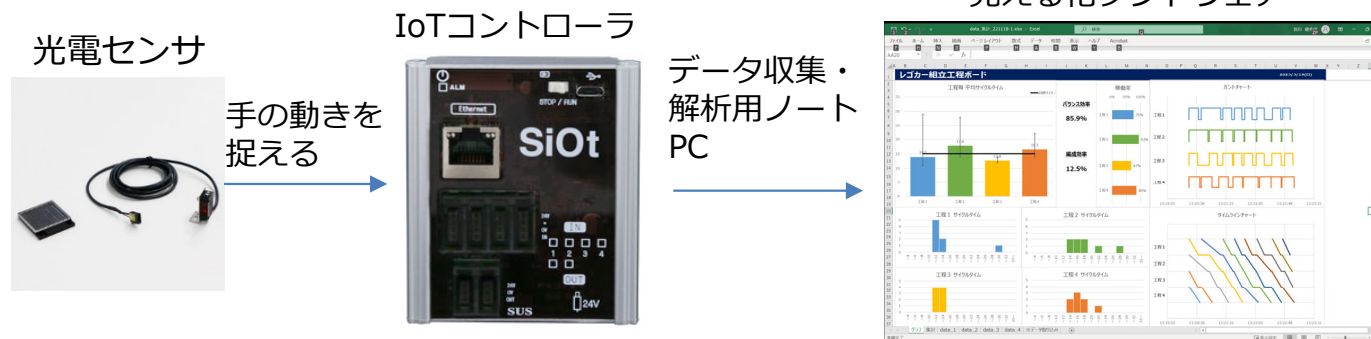
図 IoT工程分析のための演習教材

実施スケジュール：12月9日（土） 11：00－17：00， 12月16日（土） 9：10－17：00 見える化ソフトウェア