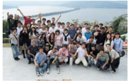
本学での思い出を忘れないでください！

卒業・修了する留学生の皆さんには、日本での留学中に体得した国際感覚と本学で学んだ様々な知識や技術を活かして、日本との架け橋となり、また世界を舞台に活躍されることを期待しています。