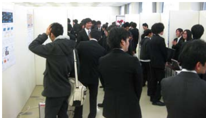
各ブースとも来場者が多く盛況でした

今回は昨年度と同様に各学科から5研究室、合計20研究室がブース出展し、ポスター展示やプロジェクターを使用したスライドショーで討論を主体としたプレゼンテーションが行われました。当日は朝からの開催にもかかわらず、会場は学内外から多数の来場者が訪れ、各ブースでは学会での発表さながらの学生による熱いプレゼンテーションに皆さん熱心に耳を傾けられ、4年間の学業の集大成を披露した同発表会は会場全体が熱気に溢れていました。