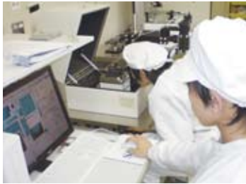
新たに導入された原子間力顕微鏡