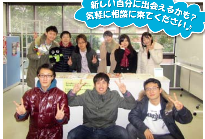
ボランティア・Linkのメンバー