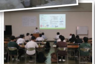
草竹コンクリート工業株式会社奈良工場・本社にて