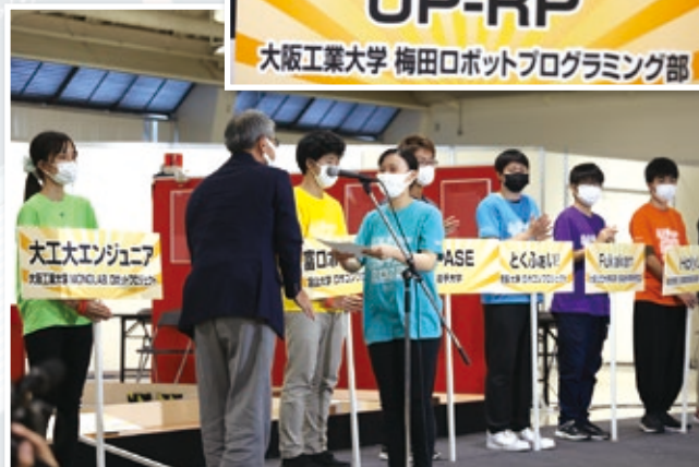
梅田ロボットプログラミング部がベストテレオペレーション賞を受賞