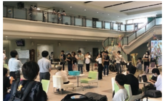
コンサート当日の様子

最終日となった7月8日には、七夕祭のクライマックスとしてウインドアンサンブルによるコンサートを実施しました。練習を重ねてきたウインドアンサンブルの音色に観覧していた約100名の学生達から大きな拍手がありました。