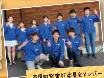
茶屋町祭実行委員会メンバー