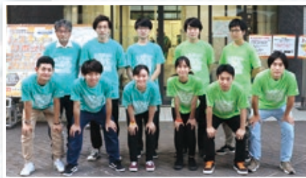
UP-RP (左) と大工大エンジュニア (右) のメンバー

8月13日、14日に神戸サンポーホール(神戸市中央区)で開催された「レスキューロボットコンテスト2022」に本学ロボットプロジェクトチーム「大工大エンジュニア」と梅田ロボットプログラミング部「UP-RP(ウーパールーパー)」が出場しました。