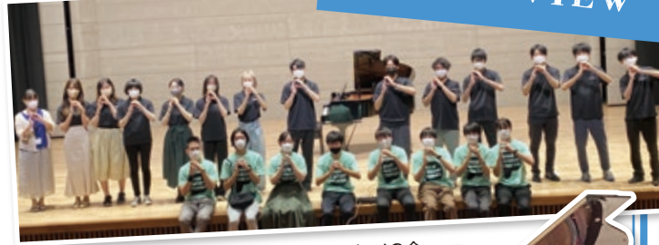
集合写真 上:黒のシャツ 大阪工業大学 ピアノの会 下:緑のシャツ 九州大学 ピアノの会

大阪工業大学 文化会 ピアノの会 YouTube https://www.youtube.com/channel/UCbs5j04avpYWsw0tufjFNXYQ