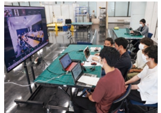
距離や時差を越えて意見交換する両大学生