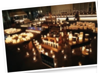
学生アワード (全体)

10月22日、大宮キャンパスと梅田キャンパスにて、「OITキャンドルナイト」を実施しました。大宮キャンパスでは、文化会本部を中心としたキャンドルナイト実行委員会を結成し、企画から運営、展示物の制作を行い、約1,500人の来場がありました。メインキャンドルは、各課外活動団体や学生プロジェクトの全メンバーが制作した3,000機以上の紙飛行機を実行委員がつなげ、最終的には5mを超える大型モニュメントを展示することができました。また、剣道部・野球部・ロボットプロジェクト・将棋部・写真研究部・機械工学研究部など課外活動団体や有志団体が各120個のキャンドルを使ってキャンドルアートを表現してくれました。そして、人力飛行機プロジェクトは過去の大会で使用した機体を展示し、OCF軽音楽部・文化会軽音楽部・ストリートダンス部・書道部は中央ステージでパフォーマンスを披露してくれました。