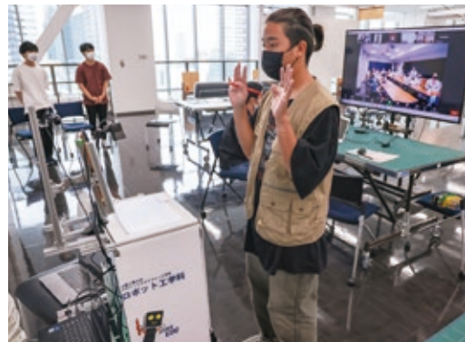
学習支援ロボットのデモを行う様子