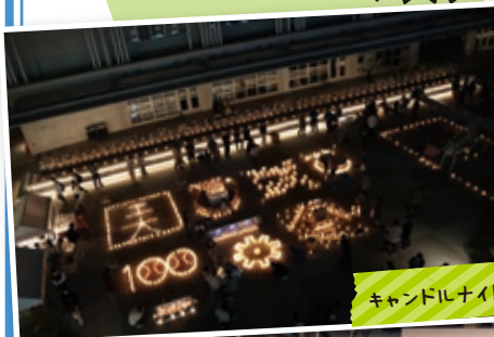
キャンドルナイト