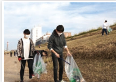
積極的にゴミを回収しました