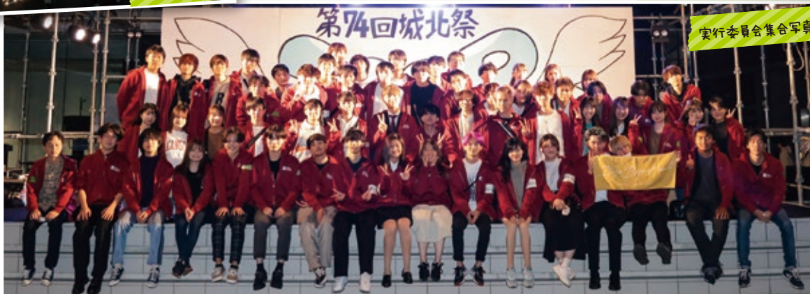
実行委員会集合写真