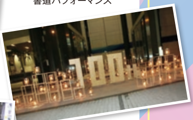
100周年をモチーフとした メインキャンドル (梅田) 「僕らのロード翔」

常翔学園創立100周年記念イベントは心地いい秋風と共に揺らぐキャンドルで彩られた空間を楽しむことができました。