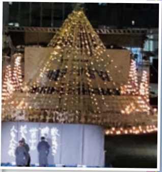
書道部による 書道パフォーマンス

梅田キャンパスでは、空間デザイン研究部を中心に、OIT梅田ボランティア部、イベントクリエイター部と有志の学生が、課外活動や学科の垣根を超え、100周年をモチーフにメインキャンドルを制作しました。「僕らのロード翔」と題し、さらに未来へ翔けていくという思いを込めました。またキャンドルの光の中、ピアノの会が、その情景にふさわしい曲目を演奏し、来場者を魅了しました。