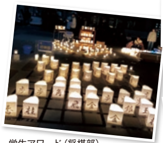
学生アワード (将棋部)

梅田キャンパスでは、空間デザイン研究部を中心に、OIT梅田ボランティア部、イベントクリエイター部と有志の学生が、課外活動や学科の垣根を超え、100周年をモチーフにメインキャンドルを制作しました。「僕らのロード翔」と題し、さらに未来へ翔けていくという思いを込めました。またキャンドルの光の中、ピアノの会が、その情景にふさわしい曲目を演奏し、来場者を魅了しました。