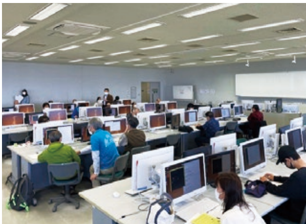
プログラミング実施の様子