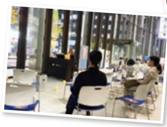
ピアノの会による ピアノコンサート