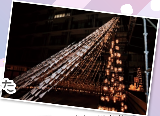
メインキャンドル (大宮)

10月22日、大宮キャンパスと梅田キャンパスにて、「OITキャンドルナイト」を実施しました。大宮キャンパスでは、文化会本部を中心としたキャンドルナイト実行委員会を結成し、企画から運営、展示物の制作を行い、約1,500人の来場がありました。メインキャンドルは、各課外活動団体や学生プロジェクトの全メンバーが制作した3,000機以上の紙飛行機を実行委員がつなげ、最終的には5mを超える大型モニュメントを展示することができました。また、剣道部・野球部・ロボットプロジェクト・将棋部・写真研究部・機械工学研究部など課外活動団体や有志団体が各120個のキャンドルを使ってキャンドルアートを表現してくれました。そして、人力飛行機プロジェクトは過去の大会で使用した機体を展示し、OCF軽音楽部・文化会軽音楽部・ストリートダンス部・書道部は中央ステージでパフォーマンスを披露してくれました。