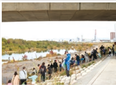
たくさんの参加者が集まり、周辺を清掃

淀川河川敷を清掃活動して水都大阪のシンボルである淀川を美しく保ち次世代に繋ぐことを目的とし、本学の文化会本部、城北祭実行委員会と旭区役所が共同で実施（協賛：大阪城北ロータリークラブ）し、本学学生、本学スポーツ教室の子供たちと保護者のみなさん、地域にお住まいのみなさんの224人が参加しました。