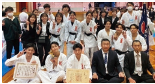
全国大会出場決定時の集合写真