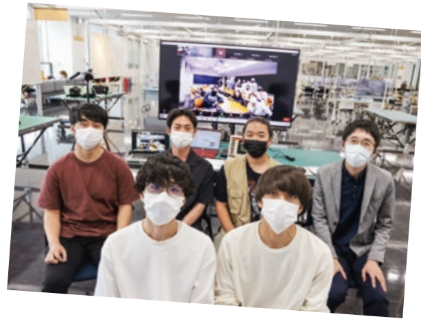
本学学生とポモナ大(画面内)の学生

ポモナ大学の学生からは、同大での運用を想定して「昼休みの食堂など、混雑している場所や時間でも問題はないか」「予想できない人の動きや位置がズレたイスなどにも対応できるのか」「清掃スタッフの仕事を奪うことになるのではないか」など、活発な意見交換が行われました。同研究室の学生は「文化が違う海外からの視点で想像できない質問もあり刺激になった」とディスカッションを振り返りました。